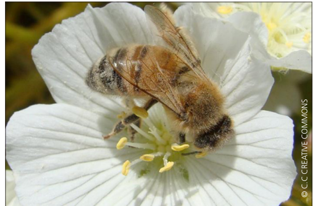
ABELHA APIS MELLIFERA POLINIZA UMA FLOR DE MACIEIRA

ATENÇÃO: ESTE DOCUMENTO NÃO DISPENSA A LEITURA ATENTA DO RÓTULO.